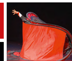
Compagnie du Petit Monsieur